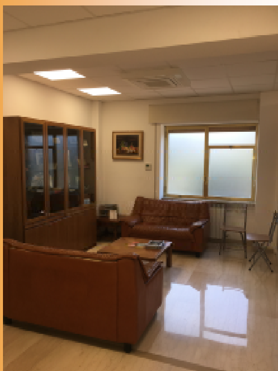
La Sala d'attesa

Gli ambulatori sono disponibili: dal lunedì al venerdì ore 8:00 - 19:00 il sabato e la domenica su richiesta